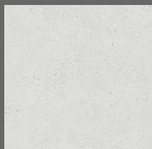
001 - Soho