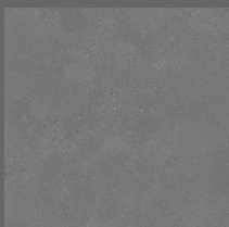
003 - Bronx