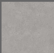
002 - Queens