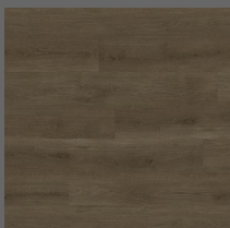
003 - Pacific Oak