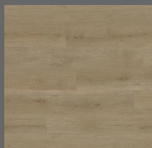
002 - Classic Oak