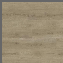
004 - Woodland Oak