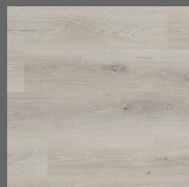
005 - Silver Oak