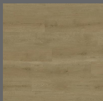
001 - Canyon Oak